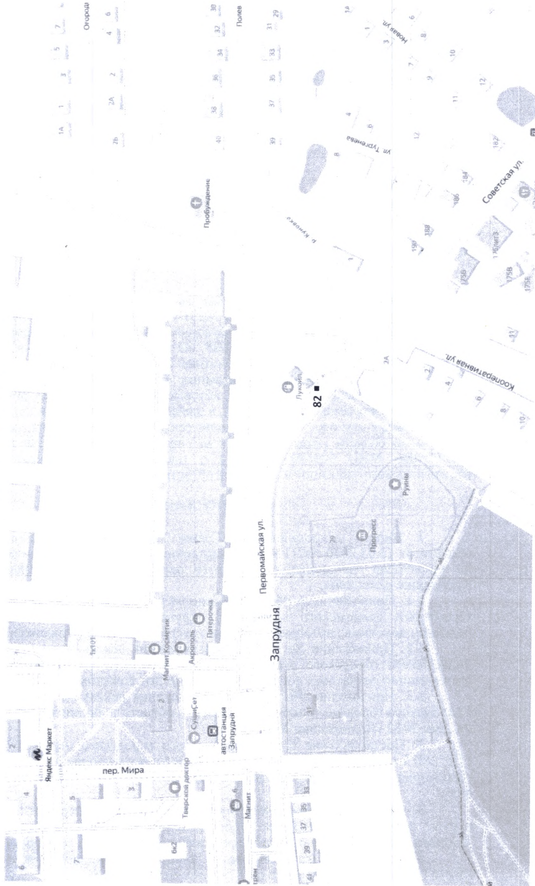
Схема размещения рекламных конструкций №82